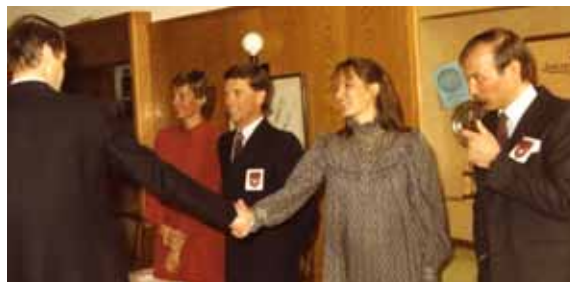
Accueil des invités au Beau-Rivage